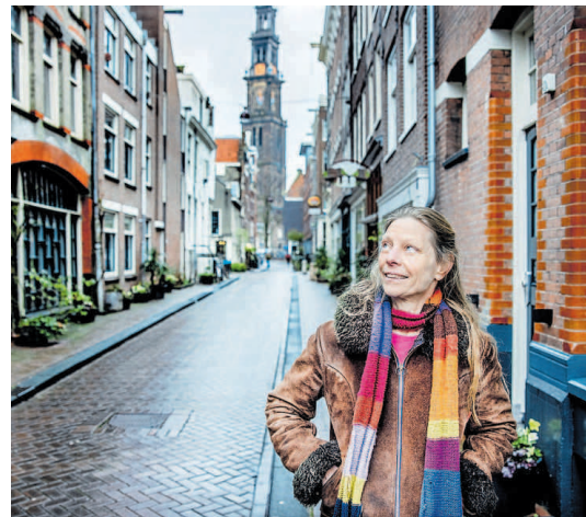
Ut Riemersma har skriuwerij sprek't ambysje: se hat lef en lit har nea ferliede ta moaiskriuwerij.

Ut Riemersma har skriuwerij sprek't ambysje: se hat lef en lit har nea ferliede ta moaiskriuwerij. Der doarmje earder sabearre punkers yn har fersen om, dy't oan it pogoën en hollebatsen binne. It begjint jin bytiden dûzeljen. Hjir kin ik net it measte mei: 'Myn spektakel dyn boppeminsklik stribjen al moastst it / dwaan mei minsklike meganika oars sein wat silst ast / krekt it bêdlampke útknipt hast mar de fakkel tusken dyn / skonken heugloeit: wa ûnthjit my dan aanst en jei de / golem fuort mei keizels op myn grêf?'